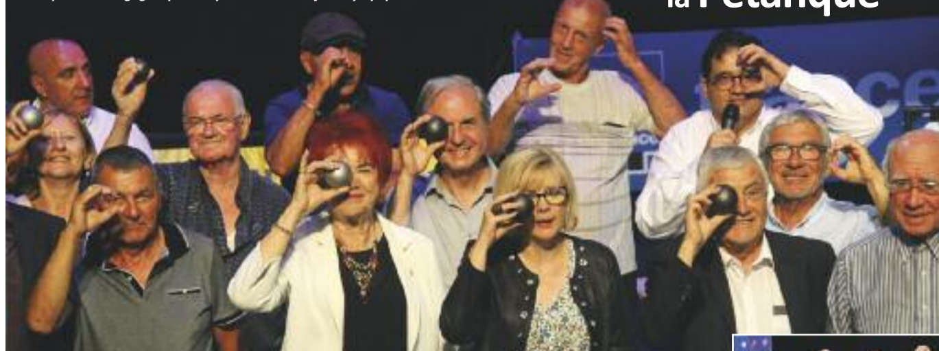
Belle déclaration d'amour de la Ville de Septèmes et de la Boule septémoise pour le sport bouliste, ce vendredi à l'Espace Jean Ferrat.

Les septémois s'engagent pour le sport bouliste aux jeux olympiques.