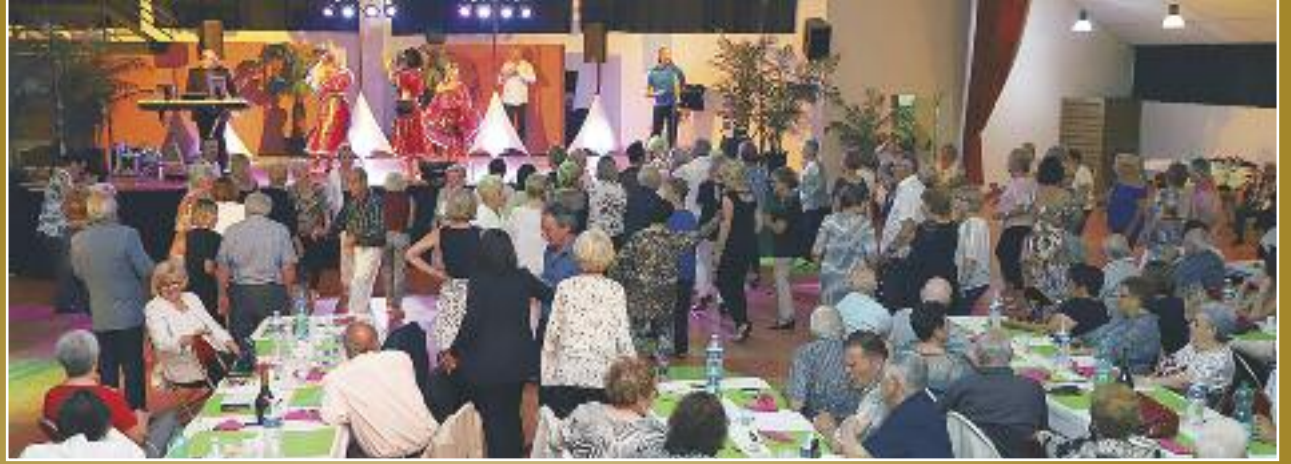
Reportage photo : Kayak photographe